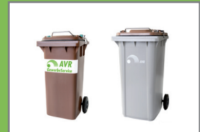
Wechselbehälter SR 120 SR 240