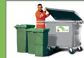
MGB 770 MGB 1,1